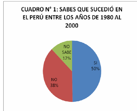
CUADRO N° 1

La pregunta indaga mas allá en la memoria de los alumnos y, relacionan el período de violencia con el gobierno de Alan García, con los atentados que sufrían los ómnibus interprovinciales que pasaban por Ayacucho, coches bombas, apagones y secuestros que se realizaban en Lima y, las largas colas que se dieron en el primer gobierno aprista, etc.