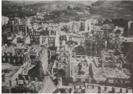
Fig. 11: La ciudad Guernica destruida por las bombas de la Legión Condor , Guernica 1937