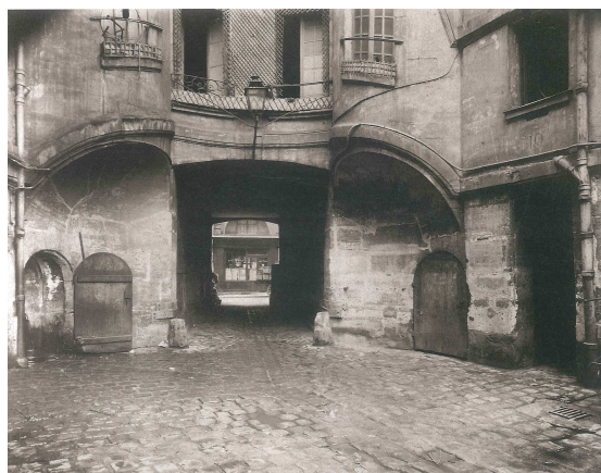
Fig. 3: E. Atget, Cour du Dragon , París, 1913