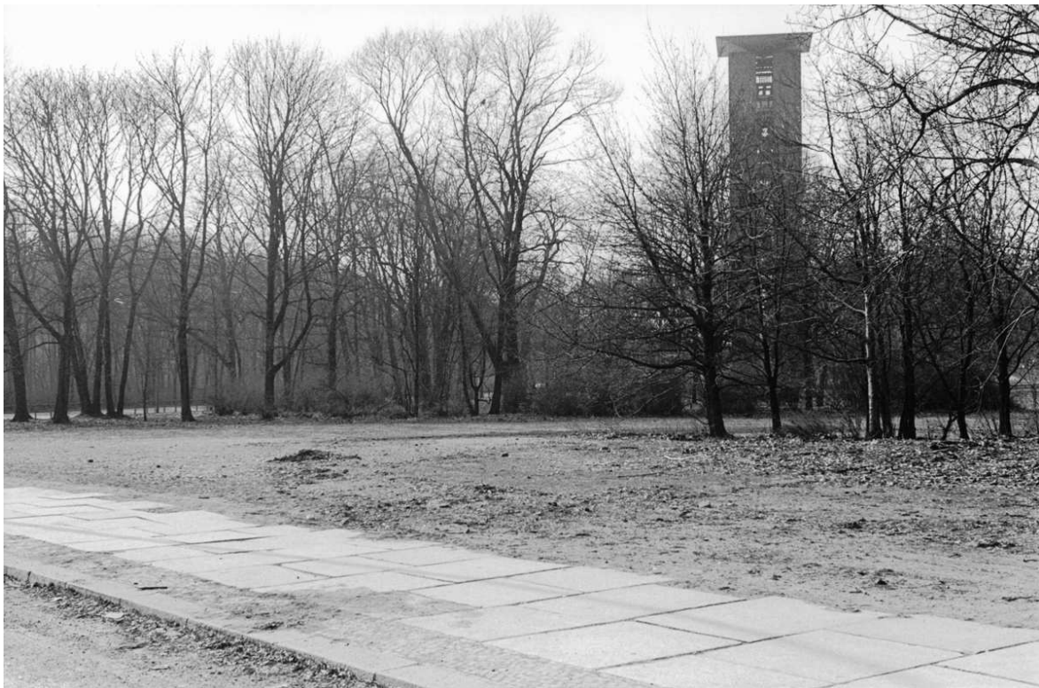
Fig. 13: Bettina Lockemann / Elisabeth Neudörfl, Plan , Berlin 1999