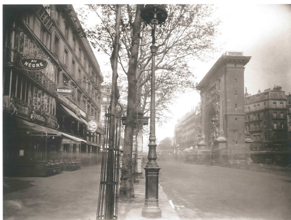
Fig. 2: E. Atget, Boulevard Saint-Denis, París, 1926