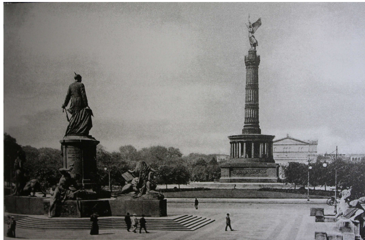
Fig. 1: Monumento a Bismarck y Columna da la Victoria , Berlín, 1915

campo visual. Mas, ¿qué es ese futuro que no se puede ver? Al revelarnos que el viento, esa fuerza ciega e incontrolable que nos empuja hacia una dirección indeseada, no es otra cosa que el progreso, Benjamin muestra que el futuro, en la concepción común del tiempo lineal progresivo, no es más que una mera promesa vacía refutada constantemente por la historia. Pero para verlo hay que salirse fuera de la lógica del tiempo lineal y sus promesas de progreso. Hay que dar la vuelta, como el ángel de la historia, y mirar hacia aquello que se tiene enfrente, delante de los ojos; ahí está todo lo que el tiempo ofrece: sus apariciones y desapariciones. No hay más que abrir los ojos.