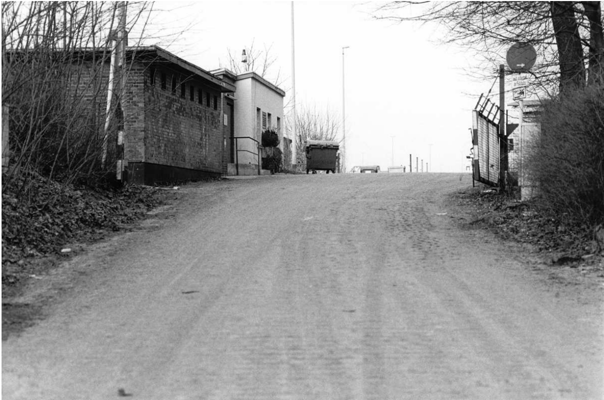
Fig. 18: Bettina Lockemann / Elisabeth Neudörfl, Plan , Berlin 1999