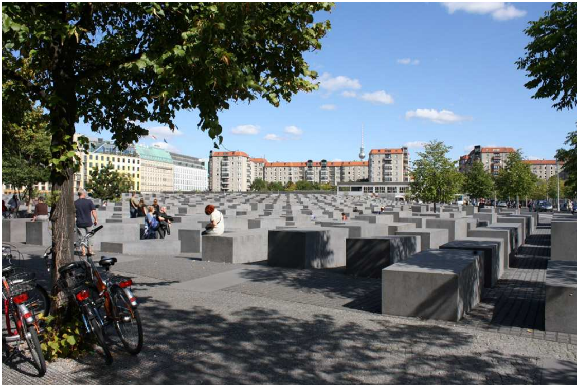
Fig. 16: Monumento a los judíos asesinados de Europa, Berlín