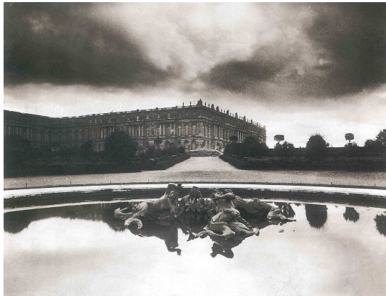
Fig. 7: E. Atget, Versailles , París, 1903