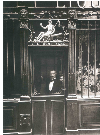
Fig. 8: E. Atget, Café "A l'Homme Armé" , París, 1900