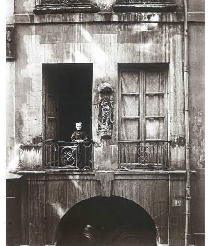
Fig. 6: E. Atget, Collège de Chanac , París, 1900