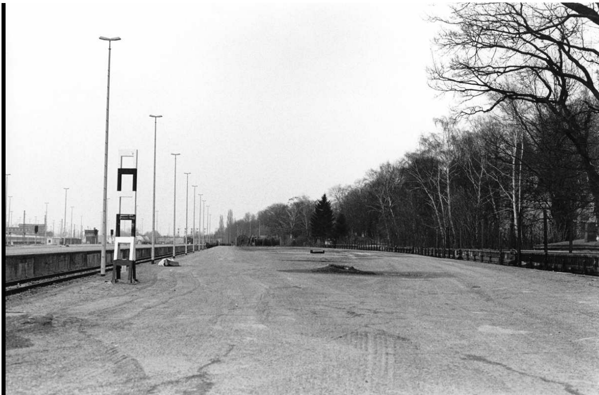
Fig. 19: Bettina Lockemann / Elisabeth Neudörfl, Plan , Berlin 1999