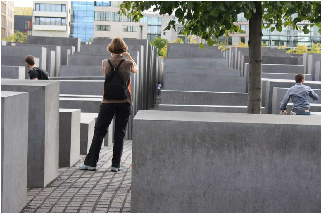
Fig. 17: Monumento a los judíos asesinados de Europa, Berlín, fotografía: A. M. Rabe

CENTRO CULTURAL DE LA MEMORIA HAROLDO CONTI Buenos Aires - Argentina