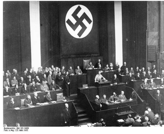
Fig. 15: Hitler justificando la Ley Habilitante en la Ópera Kroll de Berlín, 1933