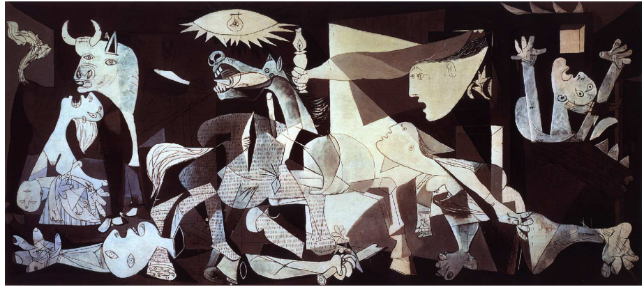
Fig. 12: Pablo Picasso, Guernica , 1937