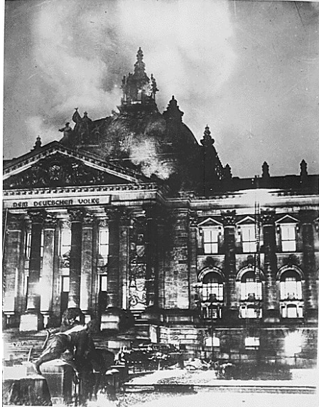
Fig. 14: Incendio del Reichstag , Berlín 1933