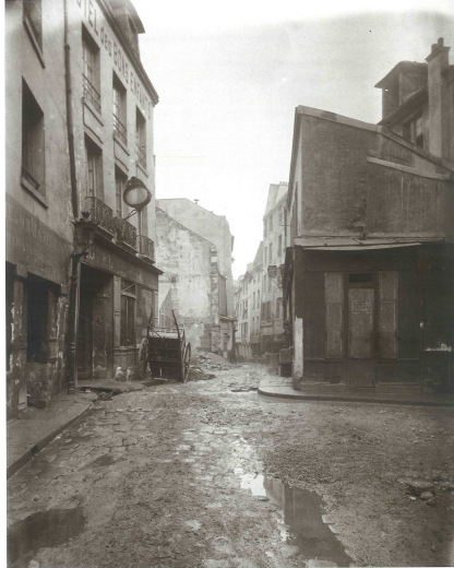
Fig. 4: E. Atget, Calle Saint-Médard, París, 1899