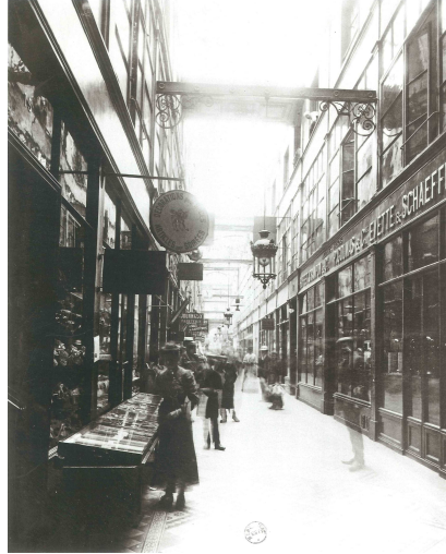
Fig.: 5: E. Atget, Passage du grand Cerf , París, 1907