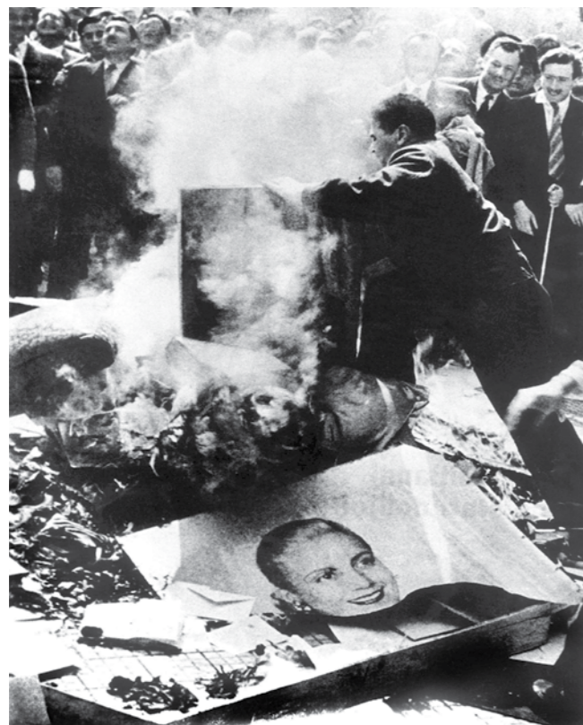
Autor: FRANCISCO VERA