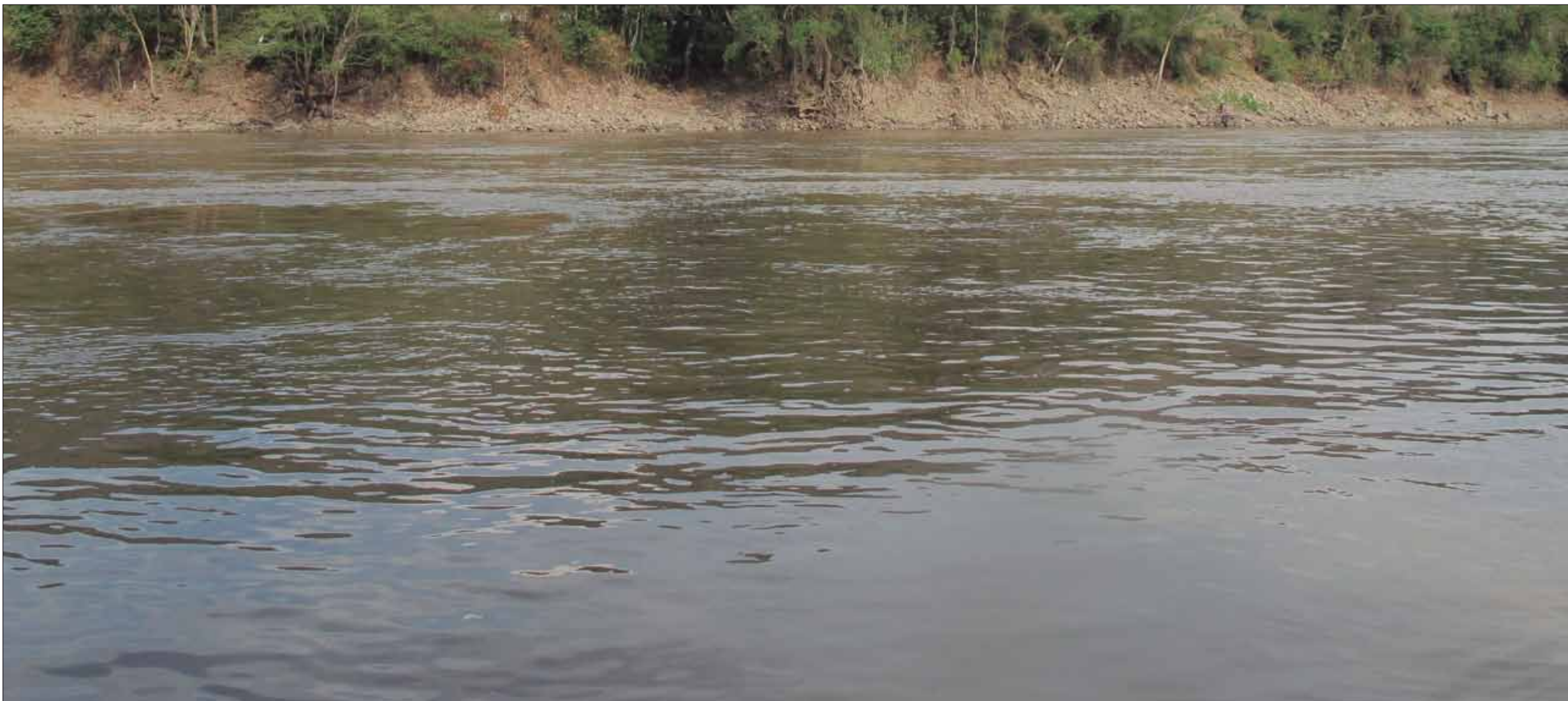
Río Magdalena. (8' 45")

It's not on any map, true places never are. No está en ningún mapa, los verdaderos lugares nunca lo están.