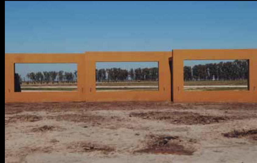
Campos de Roca Barrio privado