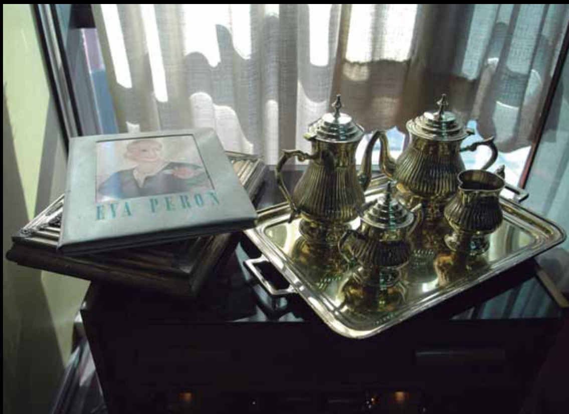
Despacho de Manuel Quindimil, Intendente del Partido de Lanús, 2007.