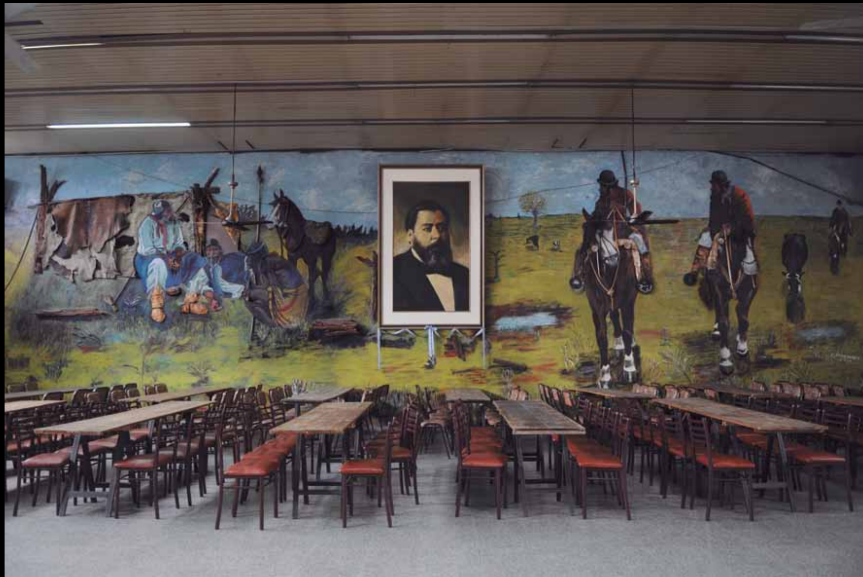
Salón de baile, retrato de José Hernández, autor del Martín Fierro . Relato de la vida de un gaucho de Buenos Aires, peón sin tierra, reclutado para combatir en la "Conquista del desierto" Avellaneda, 2009.