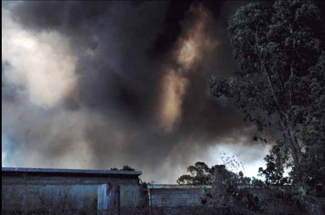
Cerco perimetral de una cementera. José León Suárez, 2011.