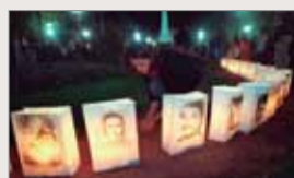
"Recorrido por la Memoria: 1955-1990. Fotos con historia" Muestra fotográfica colectiva