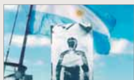
"Nunca más". Ilustraciones de León Ferrari

Las visitas se realizan de martes a viernes / 10 a 17 HS - Consultas: educacion.conti@gmail.com