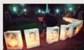
"Recorrido por la Memoria: 1955-1990. Fotos con historia" Muestra fotográfica colectiva