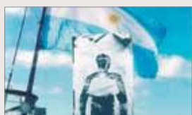
"Nunca más" Ilustraciones de León Ferrari

El Área Educación para la Memoria ofrece visitas guiadas al Centro Cultural y sus diferentes muestras. A partir de un recorrido por el arte y la cultura, se propone abordar y debatir las temáticas del terrorismo de Estado, la última experiencia dictatorial y los derechos humanos en la actualidad. Desde esta perspectiva, la experiencia de transitar un sitio de memoria tan emblemático como la ex ESMA busca poner en diálogo los saberes y conocimientos de los visitantes para seguir ejercitando y construyendo memoria(s) con las nuevas generaciones.