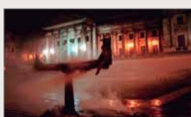
"19 y 20 de diciembre: memorias del 2001" Muestra fotográfica colectiva