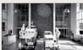
"Autores ideológicos" Muestra colectiva