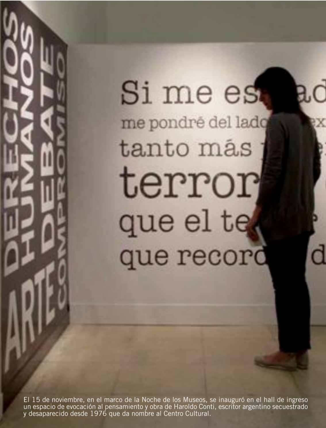
El 15 de noviembre, en el marco de la Noche de los Museos, se inauguró en el hall de ingreso un espacio de evocación al pensamiento y obra de Haroldo Conti, escritor argentino secuestrado y desaparecido desde 1976 que da nombre al Centro Cultural.