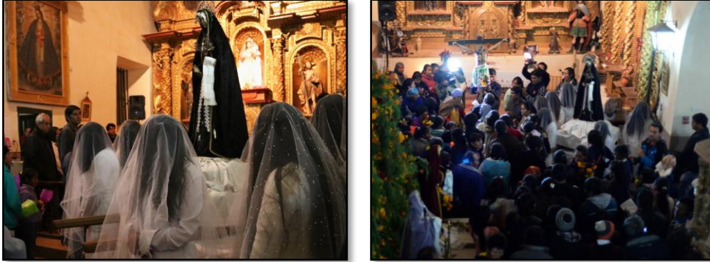
Profunda devoción en la Semana Santa en la Capilla de Yavi, Jujuy

han sido preparadas para entonar la lectura de la Pasión con cánticos que reflejan la mixtura de la voz indígena andina y las tradiciones de España, en un profundo lamento y sincero dolor hasta llegar a las lágrimas, durante toda la noche, acompañadas por su pueblo.