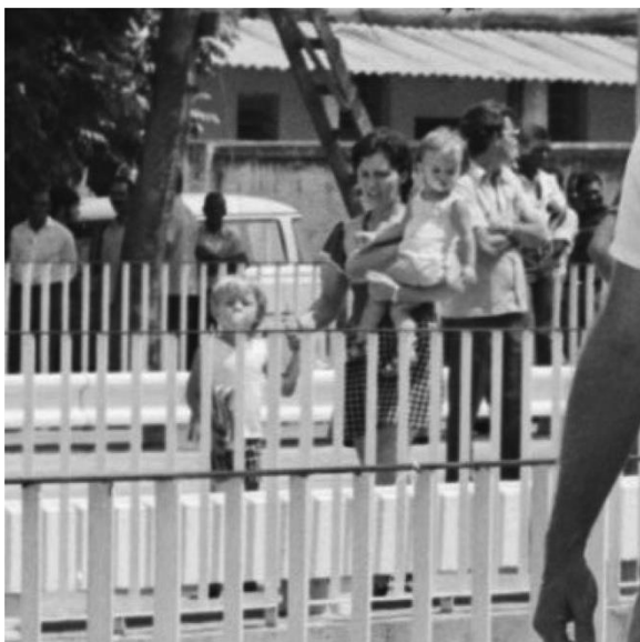
Inauguração da Ponte sobre o Arrudas (Perrela) Avenida Francisco Sales com Avenida Andradas. Prefeito Oswaldo Pierucetti ao centro. Abril de 1974. Gestão Oswaldo Pierucetti.