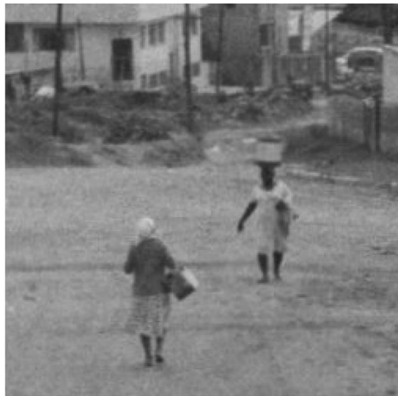
Desfavelamento em diversos bairros de BH Avenida Raja Gabaglia, esquina com Rua Josafá Belo. 24 de maio de 1966. Gestão Oswaldo Pieruccetti

Nas fotografias a presença é majoritariamente de corpos masculinos infantis. As meninas e mulheres estão ainda mais ao fundo, ainda mais fora do centro. Caminham amparadas, acompanhadas, são levadas para fora do quadro fotográfico. As mulheres negras estão ainda mais ao fundo, fora do foco, sem nitidez. É preciso um olhar atento e cuidadoso para encontrá-las em poucas das fotos. Como Ângela Alonso pontua no livro Conflitos - fotografia e violência política no Brasil a “A linha de cor é um eixo do conflito sobre o qual a letra cala, mas a fotografia delata.” (2017: 42). Se observamos os gestos, elas parecem caminhar em passo acelerado, carregam latas, trouxas de pano, levam lenço na cabeça. Trabalham, cuidam do cotidiano de vida, às costas daqueles que param e pousam para foto, trazem à luz uma certa política reversa de visibilidade.