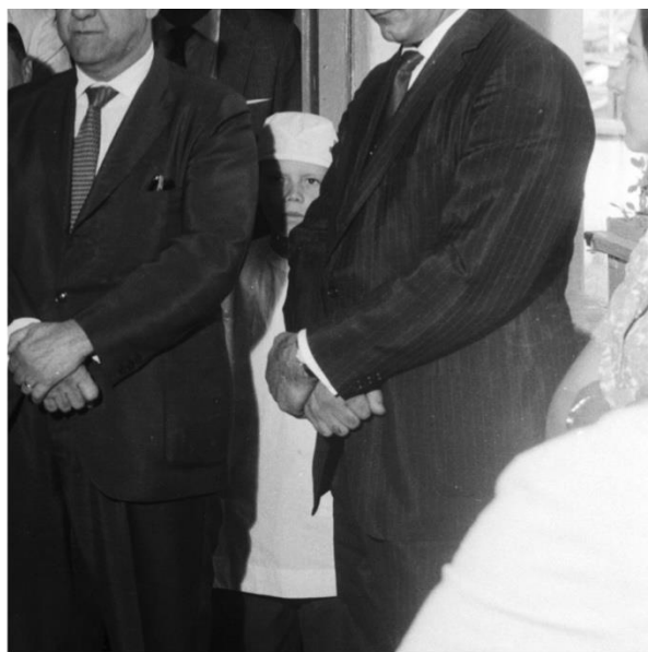
Prefeito Oswaldo Pieruccetti em inauguração de posto médico e dentário no Grupo Escolar Francisco Bressane Azevedo. Agosto de 1965. Em primeiro plano, da direita para a esquerda: 2º Prefeito Oswaldo Pieruccetti Gestão Oswaldo Pieruccetti.