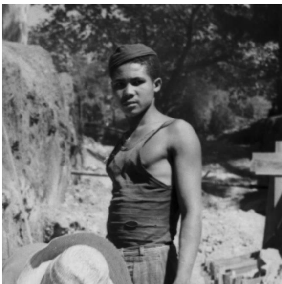
Melhoramentos no Parque - Canalização do Córrego. 13 de agosto de 1954. Gestão Américo Renê Giannetti

Nas fotografias a presença é majoritariamente de corpos masculinos infantis. As meninas e mulheres estão ainda mais ao fundo, ainda mais fora do centro. Caminham amparadas, acompanhadas, são levadas para fora do quadro fotográfico. As mulheres negras estão ainda mais ao fundo, fora do foco, sem nitidez. É preciso um olhar atento e cuidadoso para encontrá-las em poucas das fotos. Como Ângela Alonso pontua no livro Conflitos - fotografia e violência política no Brasil a “A linha de cor é um eixo do conflito sobre o qual a letra cala, mas a fotografia delata.” (2017: 42). Se observamos os gestos, elas parecem caminhar em passo acelerado, carregam latas, trouxas de pano, levam lenço na cabeça. Trabalham, cuidam do cotidiano de vida, às costas daqueles que param e pousam para foto, trazem à luz uma certa política reversa de visibilidade.