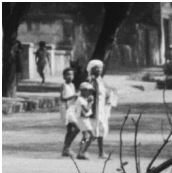
Prefeito Oswaldo Pierucetti em visita. Da esquerda para a direita: 1º Prefeito Oswaldo Pierucetti (mãos atrás). Ao fundo, lê-se em faixas: "Granjas Colombo". Setembro - Outubro de 1965. Gestão Oswaldo Pierucetti