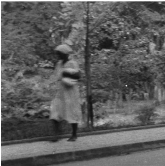
Vias asfaltadas no Parque Municipal de Belo Horizonte Janeiro 1954. Gestão Américo Renê Giannetti.