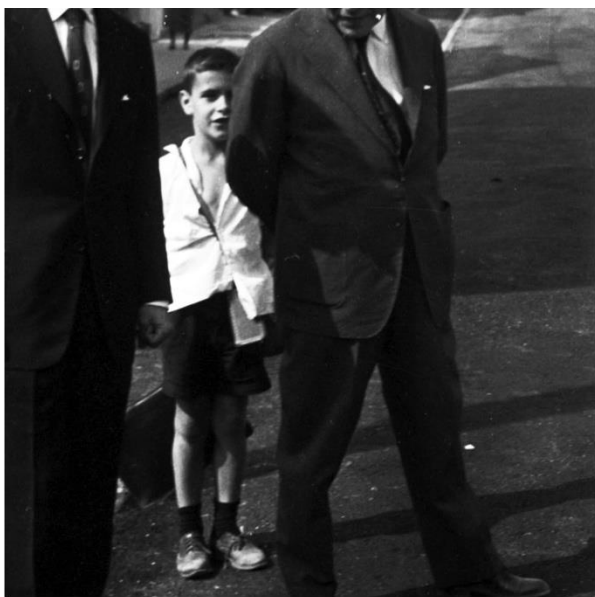
Prefeito Amintas de Barros visita obras no bairro Padre Eustáquio. Sem data, aproximadamente 1961. Em primeiro plano, da esquerda para a direita: 2º Prefeito Amintas de Barros. Gestão Amintas de Barros.

Imaginar através da ausência de imagens, ou quase, digo, em primeiro plano, ou quiçá de câmeras em mãos. Imaginar a própria imagem.