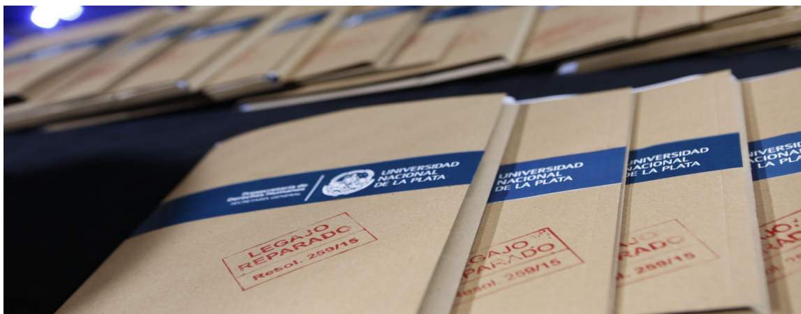
Figura 4: Imagen de los legajos reparados.

Una vez finalizado todo el proceso de trabajo que implicó llegar a los legajos reparados o en reconstrucción, la tarea se centró en la organización del acto de entrega de los mismos y el encuentro con los familiares, amigxs y compañerxs.