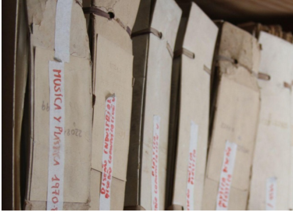
Figuras 1,2 y 3: Imágenes de la tarea de búsqueda en el archivo de la FDA.

“Los archivos testimonian nuestra historia, son fuente para la memoria y permiten a los ciudadanos el ejercicio pleno de sus derechos, situándose en primer lugar la transparencia administrativa y el acceso a la información.” (Nazar, 2007:424)