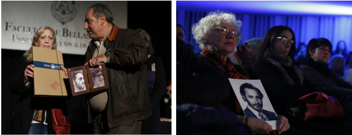
Figuras 5,6,7 y 8: Registro del acto de entrega de legajos.

Finalmente, y a modo de conclusión, vale recordar el momento en que el Decano de la Facultad planteó otra restitución simbólica al proponer el cambio de nombre de la institución: abandonar la denominación impuesta por la intervención de 1975 para volver a llamarla Facultad de Artes, tal como había sido nombrada en el breve período en que el proyecto de Universidad que soñaron lxs compañerxs homenajeadxs pareció concretarse. Esta importante decisión, hoy ya vigente, implicó no sólo saldar una deuda con ese pasado autoritario y doloroso sino también, situadxs en el presente y mirando al futuro, reafirmar un posicionamiento estético y político frente al arte que aún hoy pareciera necesitar ser defendido. Dejar de lado la idea de un arte elitista y para pocos y pensar en el acceso masivo a la educación artística necesita, tal como dice la resolución que precede cada legajo reparado, enunciados precisos “[...] la audacia para avanzar en la formulación de proyectos integradores en condiciones de instalar el arte y sus centros educativos en un país socialmente más justo dependen, en gran medida, de la lectura y la interpretación política de ese pasado y de la recuperación de la integridad propia de los/as militantes que quedaron en el camino” (Resolución UNLP N° 3899/19).