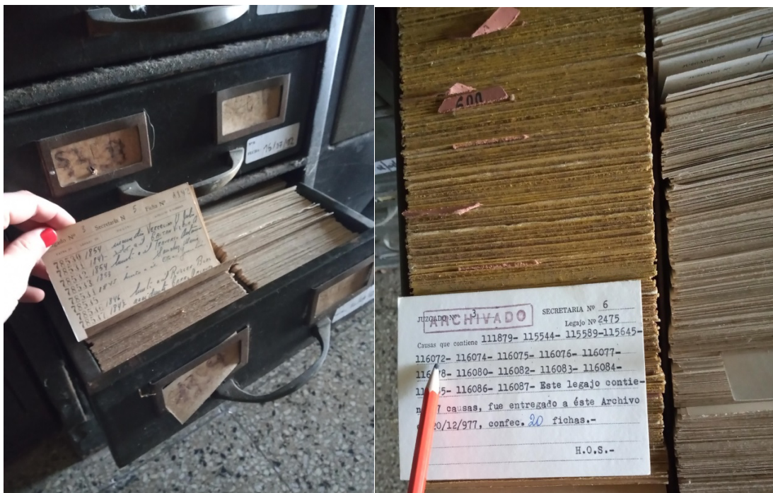
Foto de ficha alfabética.

se encontrará conservada por el tiempo que luego se determine en función del relevamiento previo a las destrucciones programadas.