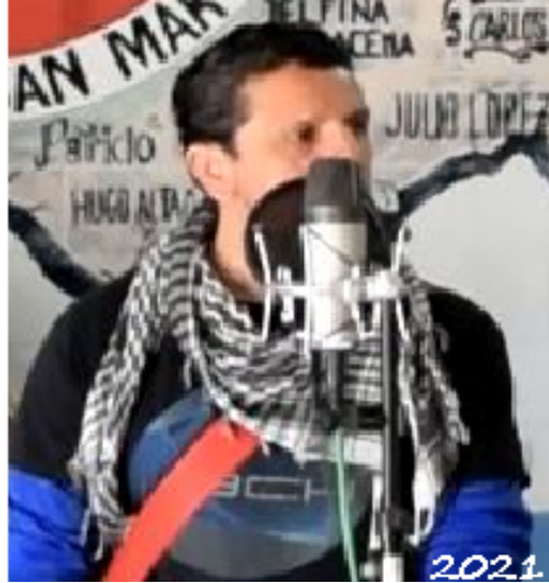
Aula donde se da el Taller de Música del SPB Unidad 48 José Leon Suarez