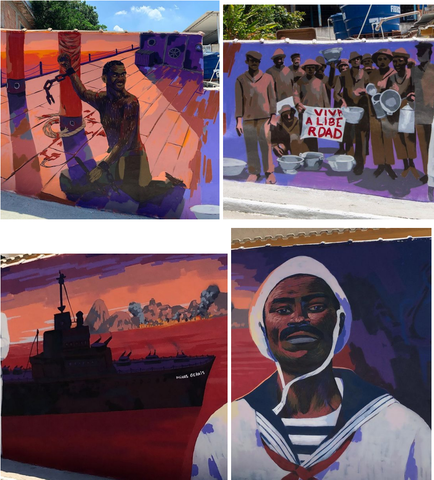
Secuencia de fotos del mural de João Candido (Instagram @NegroMuro)