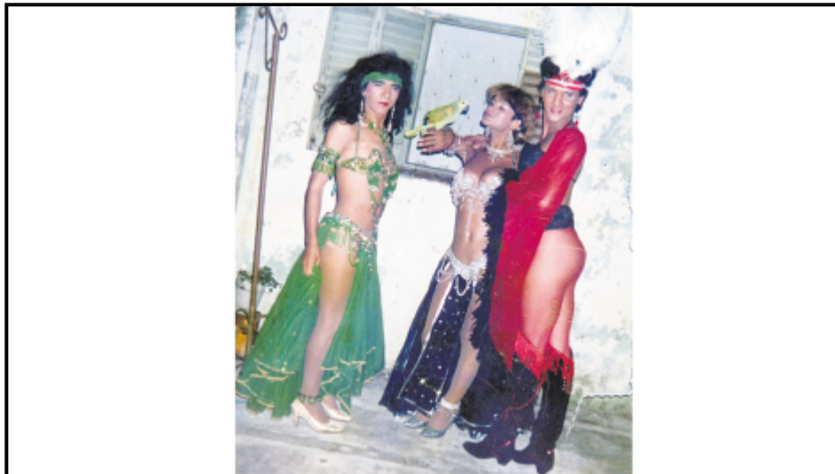
Slide La Tajo